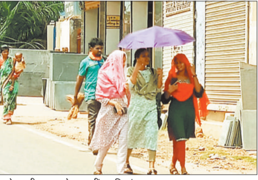
घूप से बचने छतरी का उपयोग करती लड़कियां।

जून का पहला पखवाड़ा समाप्त होते ही जशपुर क्या पूरे छत्तीसगढ़ में मानसून की धमक दिखाई देती थी। लेकिन इस वर्ष 15 जून बिताने के बाद भी लोगों के पसीने छूट रहे हैं। पिछले सालों में इस मौसम में लोग बरसात से बचने के लिए छतरी का इस्तेमाल करते रहे हैं। अप्रैल और मई में ज्यादा गर्मी नहीं पड़ी क्योंकि लगभग हर सप्ताह में एक दो दिन बारिश हो जाती थी। आम तौर पर 15 जून तक मानसून छत्तीसगढ़ में सक्रिय हो जाता था, लेकिन केरल से मानसून आने के बाद भी छत्तीसगढ़ में मानसून सक्रिय नहीं हो पाया है। पड़ने वाली गर्मी के कारण लोग हलकाकान हो रहे हैं।