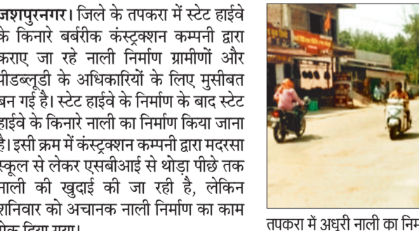
तपकरा में अचूरी नाली का निर्माण।