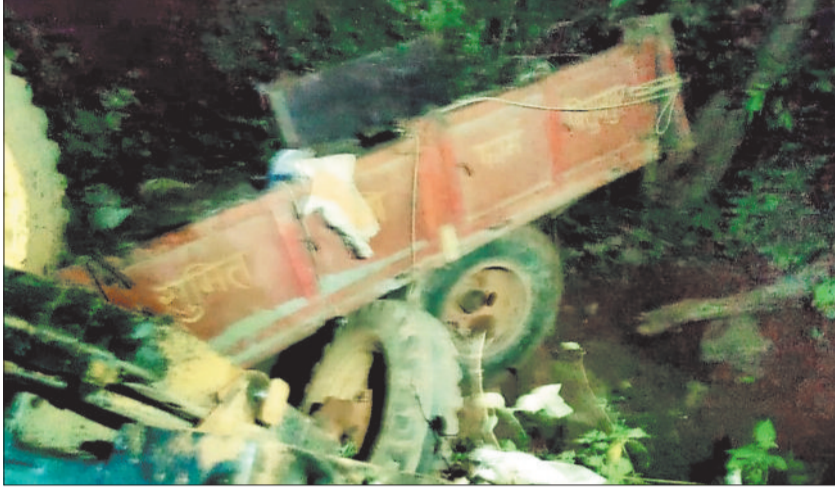
पुल से नीचे गिरा पड़ा ट्रैक्टर।

घटना 16 जून रविवार की शाम की है। पूरा मामला बगीचा ब्लॉक के ग्राम सामरबार के आश्रित ग्राम सेमरजोबला के पास घटी है। जिस जगह पीएमजीएसवाई योजना के तहत सड़क निर्माण का कार्य चल रहा था सड़क पर निर्माणाधीन एक पुलिया हेतु सेंटिंग का सामान लेकर जा रहे एक ट्रैक्टर का संतुलन खड़ी ढलान पर अचानक बिगड़ गया। जिससे चालक नहीं संभाल सका जिससे ट्रैक्टर पुलिया के नीचे जा गिरा। इस दुर्घटना में घटना स्थल पर ही चालक और मजदूर की मौत हो गई। पुलिस ने बताया कि दोनों ही चालक और मजदूर पश्चिम बंगाल के मुर्शिदाबाद जिले के हैं।