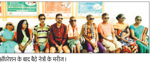
ऑपरेशन के बाद बैठे नेत्रों के मरीज।